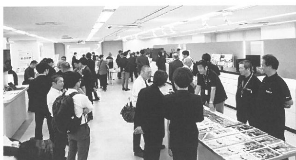
昨年6月のオープン時には多数の来場者を迎えた